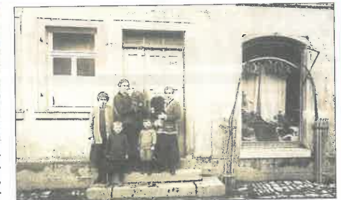
Das Foto von 1924/25 zeigte die Gaststätte Schubert, die spätere Metzgerei Geisler. In der Auslage rechts im Bild wurde die Wurst der Familie Ziegler ausgestellt.

„Damals, vor dem Zweiten Weltkrieg, gab es in Euerbach gleich drei Metzgereien. Eine davon war eine „hauptamtliche“ Metzgerei, würde man heute sagen. Die beiden anderen wurden von den Dorfwirten betrieben.